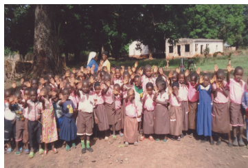
Aiuti sanitari per bambini (Sudan, Africa)