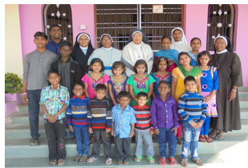
Casa accoglienza bambini (Ujjain, India)