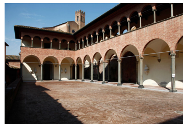
Santuario casa di S. Caterina (Siena, Italia)

In questi anni Piccola Via ha promosso la ristampa del libro di preghiere " Chi prega si salva " e del piccolo " Catechismo per i bambini ", inviati in oltre 25.000 copie in Italia e nel mondo.